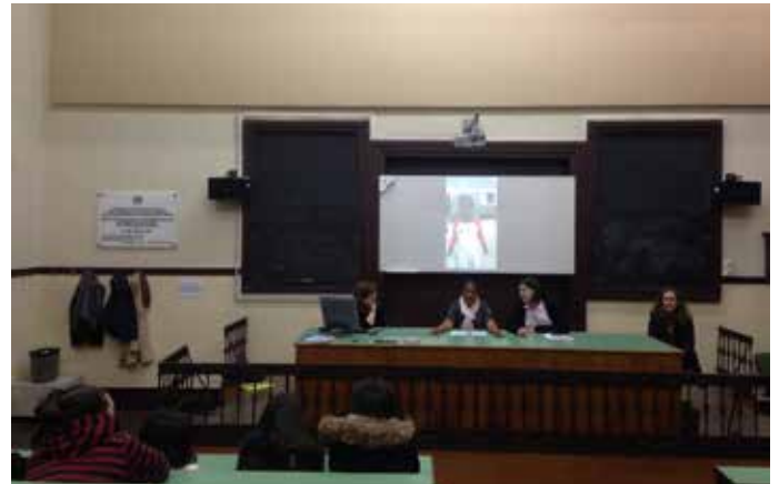
I.E.S. Cardenal Cisneros, 13 de marzo de 2017