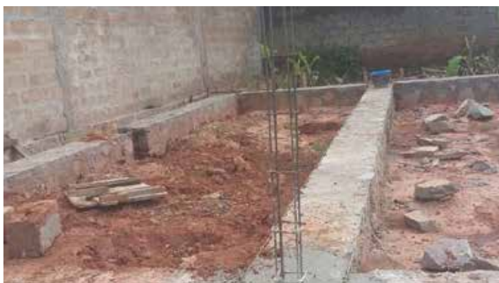
Cimientos del dormitorio 9 de diciembre de 2017