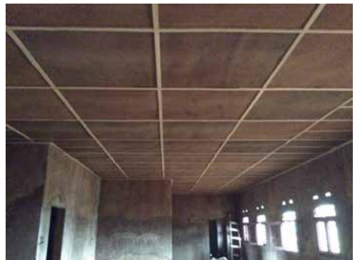
Agosto de 2017