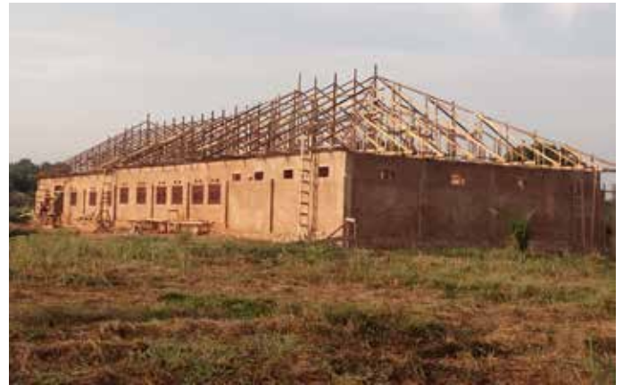
Febrero de 2017

Como es un proyecto de gran envergadura la planificación se llevó a cabo en 2015, y durante 2016 se ha hecho el desembolso y la mayor parte de la ejecución. Por la situación actual del país no se ha podido hacer la inauguración formal y aún no hay fecha para ello.