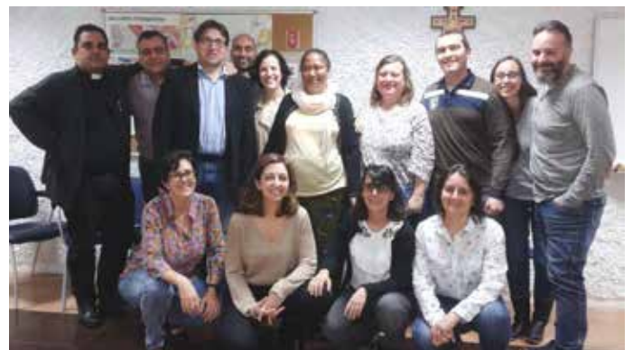
Coloquio Comuna, 11 de marzo de 2017