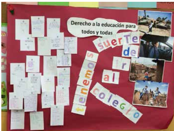
Colegio A Ponte Pasaxe, 4 de diciembre de 2017