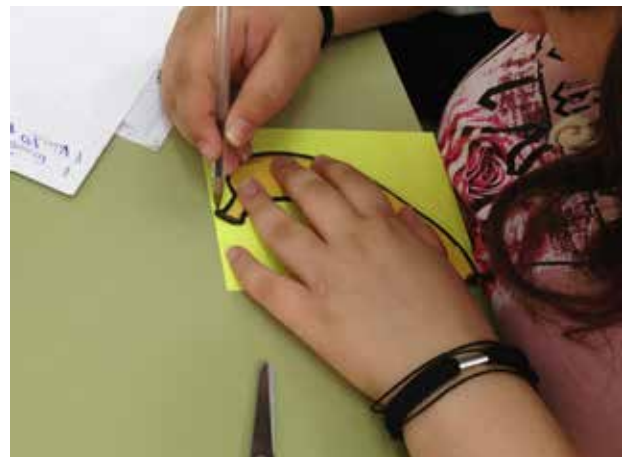
I.E.S. Sta. Teresa de Jesús, 5 de junio de 2017