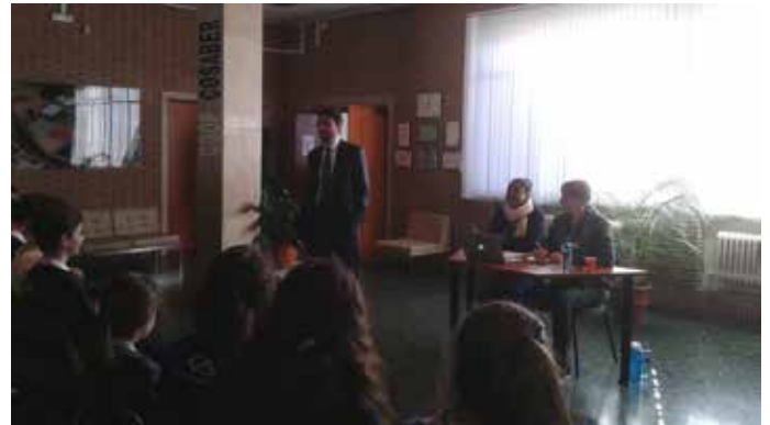
Colegio Bernadette, 8 de marzo de 2017

Muchos amigos de Dilaya estuvieron presentes de una u otra manera para conseguir que se llevaran a cabo las actividades, abriéndonos las puertas de