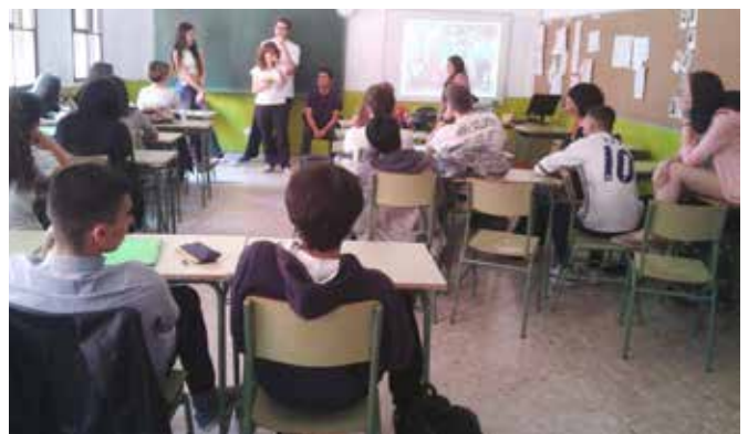
I.E.S. Sta. Teresa de Jesús, 22 de mayo de 2017