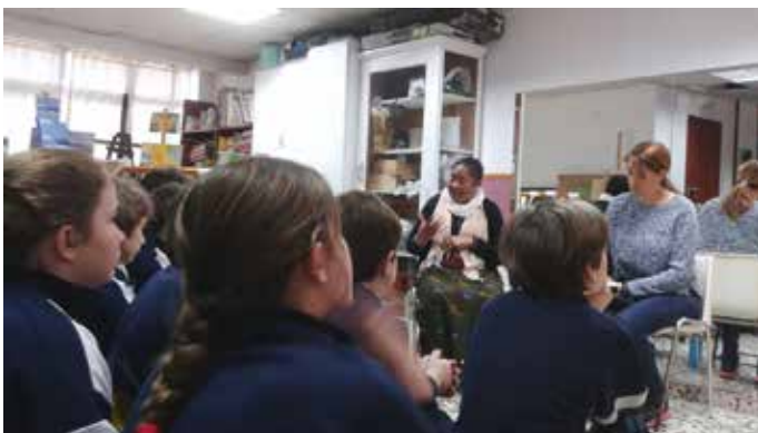
Colegio Nervión, 23 de marzo de 2017