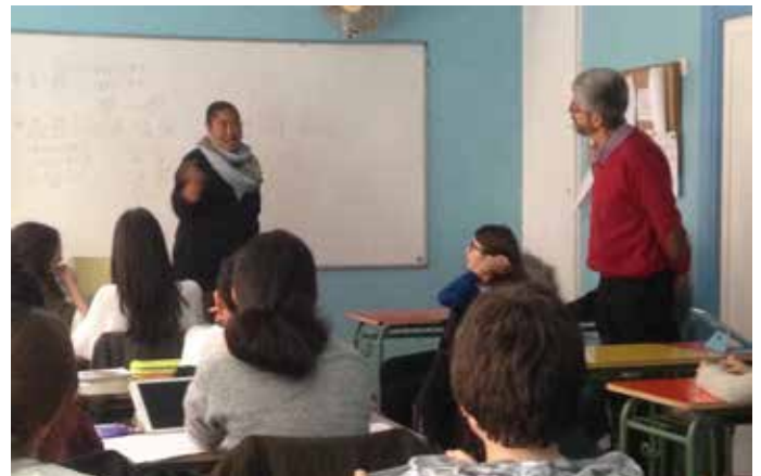
I.E.S. Beatriz Galindo, 15 de marzo de 2017