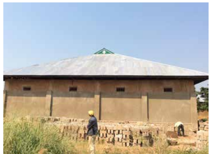
Junio de 2017