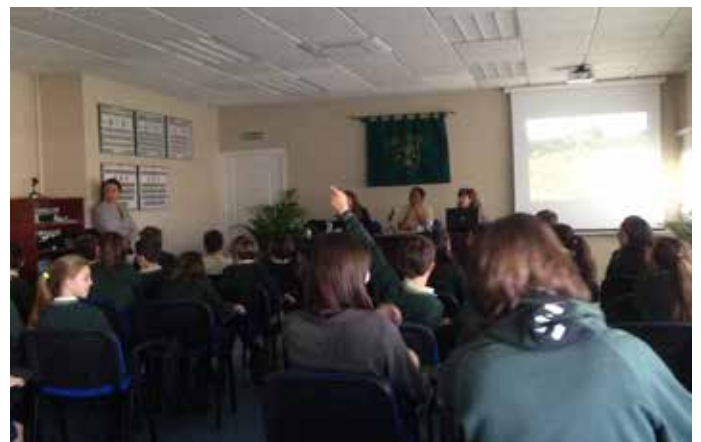
Colegio Los Sauces, 9 de marzo de 2017