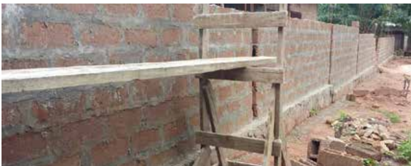
Elevación del primer lado del muro. 18 de noviembre de 2017