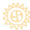
Detalle del Plan de Actuación de Padres