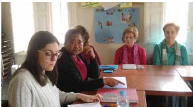
Mujeres de la Parroquia de San Sebastián, Carabanchel, 22 de marzo de 2017