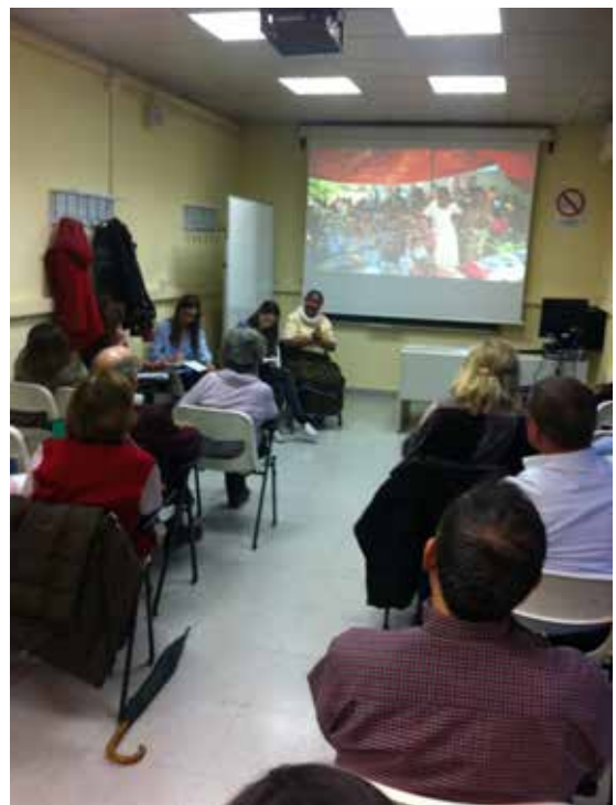
Universidad para Mayores de la Complutense, 29 de marzo de 2017