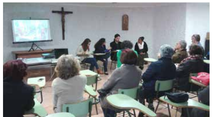
Parroquia Epifanía del Señor, 12 de marzo de 2017