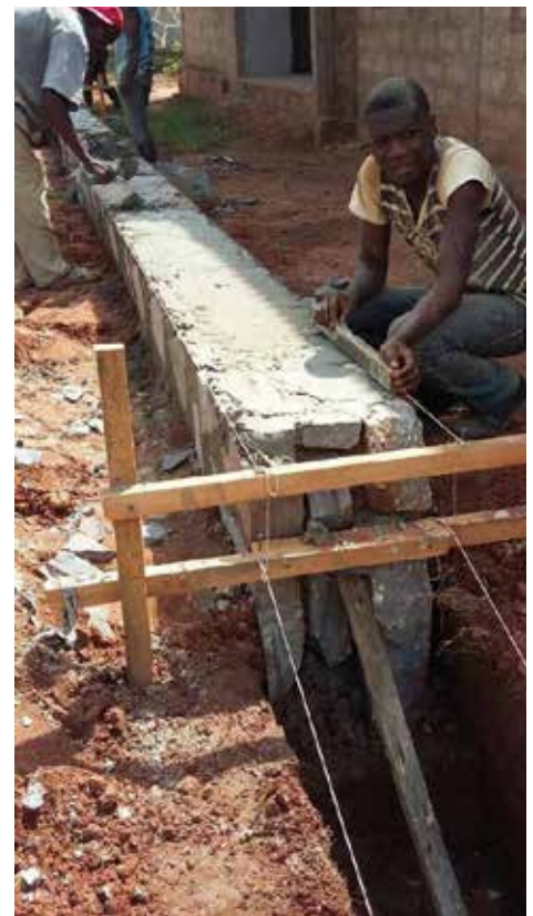
2 de noviembre de 2017